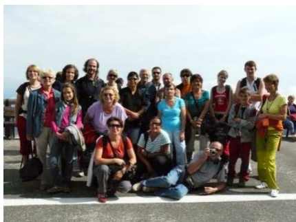
Výlet Orlí hnízdo

Bohužel se neuskutečnily dvě akce pro děti. Maškarní rej z důvodu stěhování a oslavy Dne dětí, protože se žádné z dětí nedostavilo.