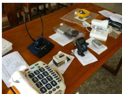
Kompenzační pomůcky – Interhelp

Dále se pořádaly akce: výlet do Prahy, Brna, na Orlí hnízdo (Německo), Den matek, přednáška s besedou na téma „Indie, adopce na dálku“ a Mikulášská besídka.