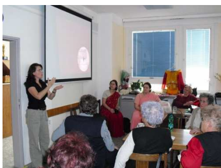
Přednáška „Indie, adopce na dálku“